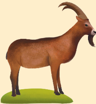
Çengel Boynuzlu Dağ Keçisi