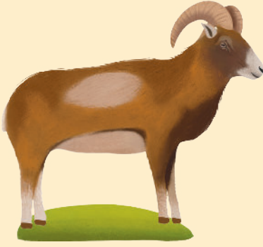
Anadolu Yaban Koyunu